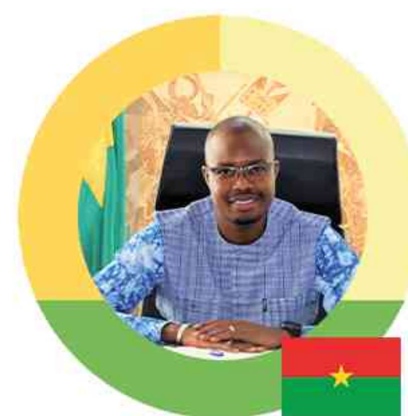
SOUS LE PATRONAGE Jean Emmanuel OUÉDRAOGO Ministre de la Communication de la Culture, des Arts et du Tourisme