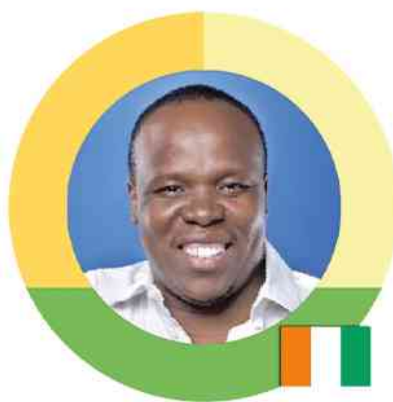
PARRAIN Salif TRAORÉ Commissaire général du FEMUA